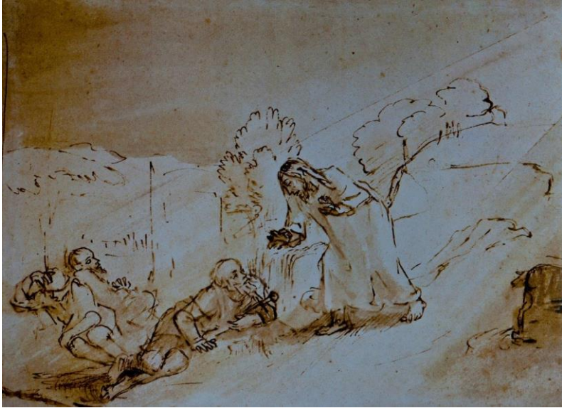
Jezus in Gethsemane ( Rembrandt)