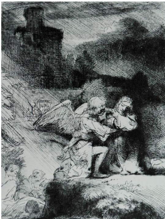
Jezus in Gethsemane ( Rembrandt)

Zingen: In stille nacht houdt Hij de wacht, Lied 571: 1, 4, 5